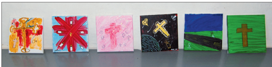
Et udsnit af de fine billeder, som årets konfirmander har lavet med kristne symboler.

I påskeugen vil der være mulighed for at gå på kirkegården og deltage i vores lille påskeløb. Der er fire poster og en overraskelse, når man kommer til den sidste post! Husk, at kirkegården også er et sted, hvor der kommer sørgende, så vis hensyn og respekt, hvis der er andre besøgende.