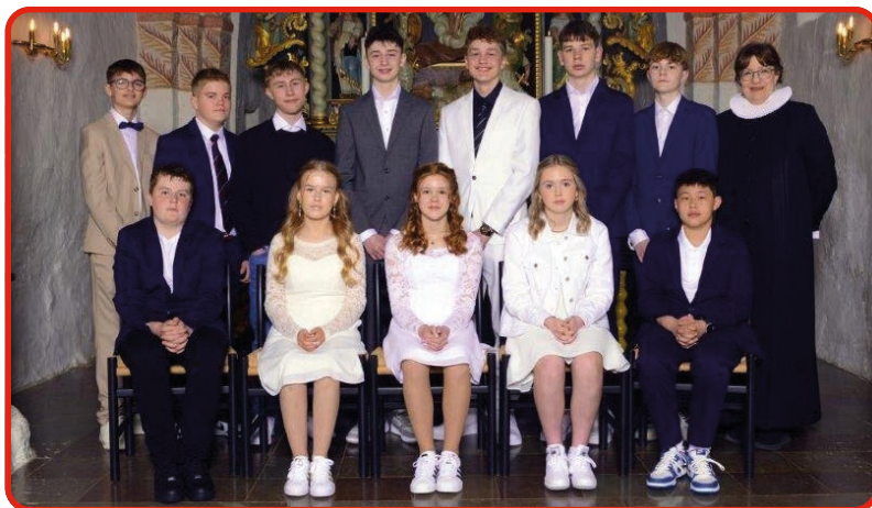
Auning Kirke d. 21. april kl. 10.00