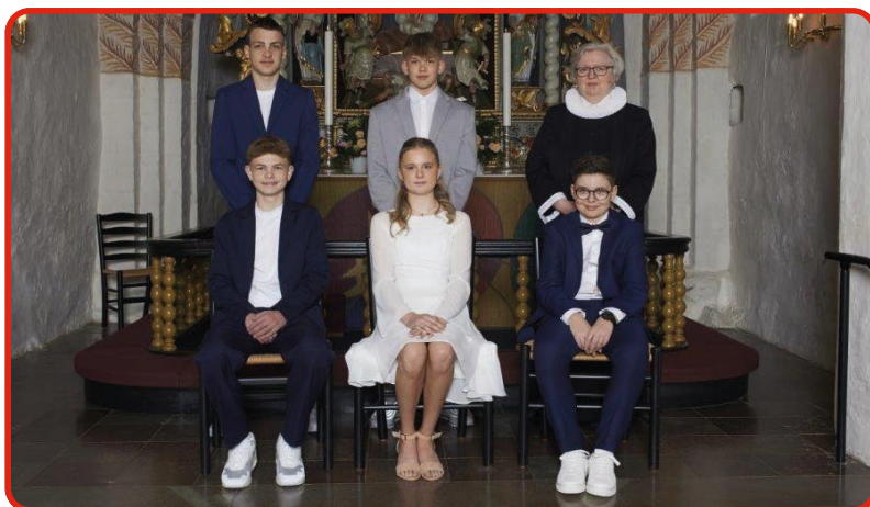
Auning Kirke d. 28. april kl. 10.00