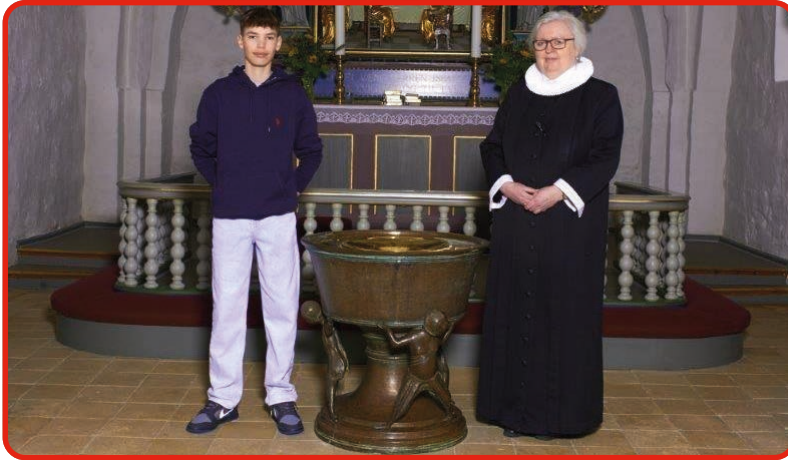
Fausing Kirke d. 20. april kl. 9.00