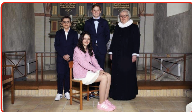
Øster Alling Kirke d. 20. april kl. 10.30